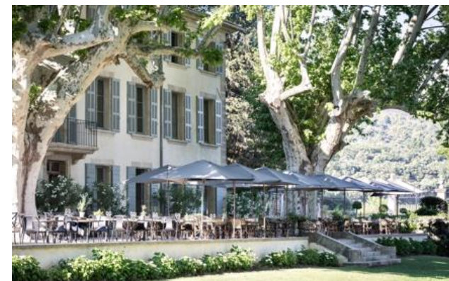
Membro Relais & Châteaux dal 2019 Route de Roquefraiche 84360, Lauris

Hotel e ristorante in campagna. Nel cuore del parco naturale del Luberon, fermate il tempo con una sosta al Domaine de Fontenille. Degna di un romanzo di Giono o di Pagnol ambientato nell'incantevole e suggestiva campagna provenzale, questa residenza padronale immersa tra cedri e ulivi secolari rappresenta la cornice perfetta dell'art de vivre francese. Negli arredi della proprietà convivono diverse epoche e savoir-fare: a un'atmosfera da dimora familiare pregna di ricordi, si accosta un centro d'arte contemporanea, realizzato nell'antica cantina - Opere d'arte originali decorano le diciannove camere e suite affacciate sul parco, tra cui un antico lavatoio trasformato in cantuccio romantico. Il ristorante stellato Le Champ des Lunes diretto dallo chef Michel Marini, la spa, l'antico vigneto e l'orto aperto al pubblico contribuiscono a creare un'atmosfera da sogno.