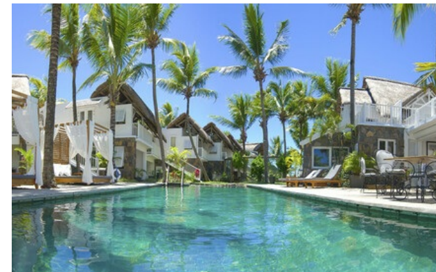
Membro Relais & Châteaux dal 2013 Coastal Road, Pointe Malartic Grand-Baie Pointe aux Canoniers

Hotel e ristorante sul mare. In una piantagione di cocco in riva all'acqua, una bella casa coloniale ospita un piccolo hotel de charme ammobiliato con gusto e raffinatezza. Nelle camere, i toni soavi e neutri dei mobili Flamant Home Interiors contrastano col blu del mare e il verde delle palme. Il ristorante propone una deliziosa cucina creola e internazionale. Ma 20 Degrés Sud Boutique-hôtel cela degli altri tesori: il M/S Lady Lisbeth, la barca a motore più vecchia dell'isola, che la sera imbarca alcuni ospiti per una cena sotto le stelle nelle acque tranquille della baia.