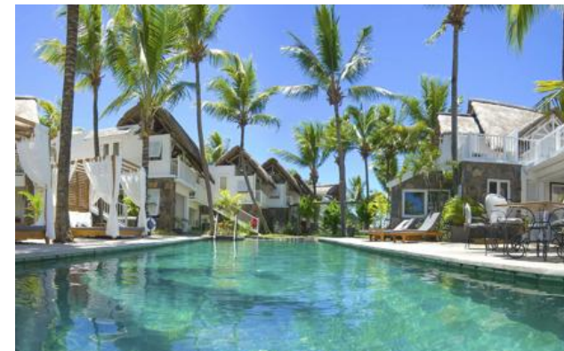
Membro Relais & Châteaux dal 2013 Coastal Road, Pointe Malartic Grand-Baie Pointe aux Canonnières

Hotel e ristorante sul mare. In una piantagione di cocco in riva all'acqua, una bella casa coloniale ospita un piccolo hotel de charme ammobiliato con gusto e raffinatezza. Nelle camere, i toni soavi e neutri dei mobili Flamant Home Interiors contrastano col blu del mare e il verde delle palme. Il ristorante propone una deliziosa cucina creola e internazionale. Ma La Maison 20 Degrés Sud cela degli altri tesori: il M/S Lady Lisbeth, la barca a motore più vecchia dell'isola, che la sera imbarca alcuni ospiti per una cena sotto le stelle nelle acque tranquille della baia.