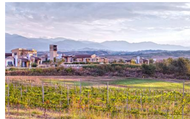
Membro Relais & Châteaux dal 2017 2821, Zornitza Village (Sandanski)

Hotel e ristorante in campagna. Scolpita nella pietra grazie al sogno di una famiglia di esteti innamorati della loro patria, la Zornitza Family Estate produce vino, miele e tartufi, coltiva frutta e verdura biologica e alleva il proprio bestiame. La residenza principale sfoggia un design moderno, utilizzando materiali tradizionali. La cucina è semplicemente fantastica; il servizio incantevole. Un soggiorno in questa proprietà è un'occasione unica per scoprire la parte meridionale della Bulgaria in tutta la sua ricchezza e autenticità: dalle tradizioni locali alla storia dei diversi siti archeologici, dalla regione della Tracia all'antica Grecia, passando per la degustazione di vini unici della straordinaria cantina della tenuta e delle tredici aziende vinicole dell'area.