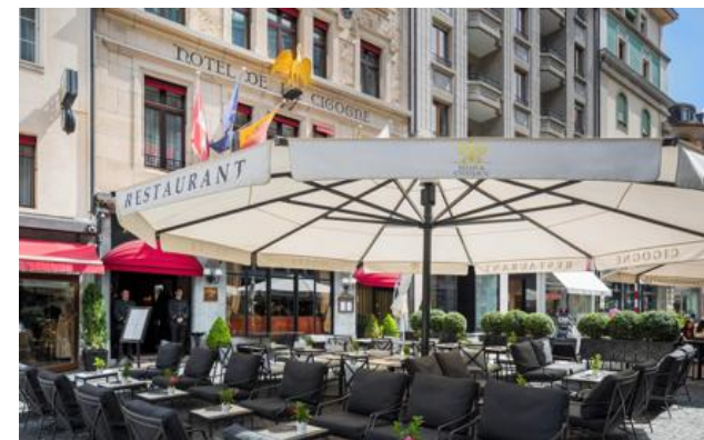
Membro Relais & Châteaux dal 1989 17, place Longemalle CH-1204, Genève

Hotel e ristorante in città. La scoperta delle bellezze ginevrine inizia con l'Hotel de la Cigogne, un'oasi di pace e tranquillità nel cuore della Ginevra animata e commerciale, a soli due passi dal centro storico, dal lago e dal quartiere culturale. Nella piazza Longemalle, la cicogna dorata che troneggia sulla porta dell'hotel annuncia un palazzo le cui camere, tutte diverse una dall'altra, sono state ripensate in un'ottica ringiovanita e dinamica. Per quanto riguarda la cucina, potete concedervi delle deliziose pause gastronomiche in questo scrigno dove le composizioni inedite si possono degustare anche sul terrazzo.