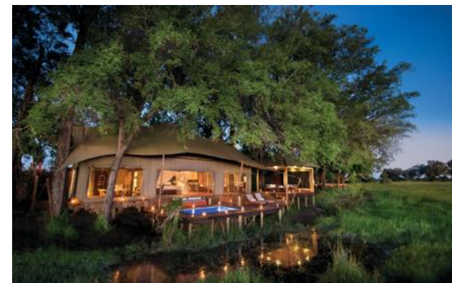
Membro Relais & Châteaux dal 2017 Duba Plains Private Reserve Okavango Delta

Lodge e ristorante in una riserva naturale. Immerso all'interno di una vasta concessione privata nel nord del Botswana, il Duba Plains Camp esaudisce tutti i sogni degli amanti dell'Africa e dei suoi incantevoli paesaggi. Vivete un'esperienza safari indimenticabile, nel comfort di una delle cinque spaziose suite distribuite in tende stile anni Venti, ciascuna con piscina privata e vista mozzafiato sulle pianure verdeggianti del delta dell'Okavango. Insieme alla vostra guida privata, partite per un safari fluviale e a piedi alla scoperta di uccelli e centinaia di animali, tra cui le interessanti specie del Kalahari. Rigenerate la mente vivendo ogni giorno a stretto contatto con questo paradiso selvaggio, oggetto di un programma di conservazione che coinvolge le popolazioni locali. Esploratore di National Geographic, il cofondatore di Duba Plains Camp ha dichiarato di non riuscire a immaginare un'esperienza di safari più completa di quella del Botswana o di qualsiasi altro paese dell'Africa. Pronti a partire?