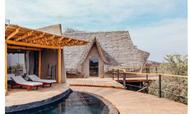
Membre Relais & Châteaux depuis 2013 Mbirikani Group Ranch Chyulu Hills - Amboseli

Lodge et restaurant dans une réserve animale privée. Réveil au pied des sommets enneigés du Kilimanjaro ; au loin, le rugissement d'un lion. ol Donyo Lodge est un pionnier parmi les safaris-lodges, précurseur du tourisme éthique et responsable: la collaboration avec la population Massai locale a permis de combiner sauvegarde et subsistance. Installé sur les flancs des Chyulu Hills, ce lodge mélange design contemporain et traditionnel. C'est l'opportunité d'explorer l'Afrique d'une manière peu commune, à cheval ou en 4x4, ou encore posté dans une cache, à vingt pas de certains des plus grands éléphants du monde. Surplombant la savane à perte de vue, ol Donyo Lodge jouit d'une situation incomparable. C'est l'Afrique comme on l'imagine.