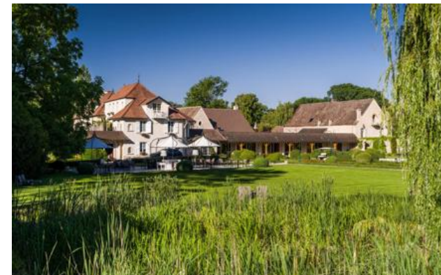
Table de Levernois* ouvert pour les diners du Jeudi au Lundi et dimanche au déjeuner. En Juillet et Aout, ouvert tous les jours au diner. Bistrot du Bord de l'Eau est ouvert tous les jours au déjeuner et au diner. Bistrot de Bord de l'Eau, ouvert tous les jours au déjeuner et au diner

Membre Relais & Châteaux depuis 1991 15 Rue du Golf 21200, Levernois (Côte-d'Or)