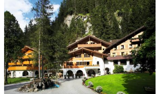
Miembro de Relais & Châteaux desde 2016 Doldenhornstrasse 26 3718, Kandersteg

Hotel y restaurante en la montaña. Este hotel familiar, situado en la pequeña estación de esquí de Kandersteg, con sus grandes chalés en un enclave de árboles de hoja perenne y sus vistas de los terrenos más allá de las montañas, es una auténtica escena digna de postal. Tanto en invierno como en verano, saboree las delicias de la naturaleza circundante, accesibles directamente desde el hotel, o disfrute de las numerosas instalaciones de bienestar (piscina, sauna, termas, espacio de relajación) construidas basándose en el respeto hacia el medio ambiente. Las habitaciones están acondicionadas con gusto y ofrecen vistas panorámicas del bosque o de las montañas. La bienvenida personalizada, la atmósfera cálida y la maravillosa cocina contribuyen a revitalizar cuerpo y alma. Al otro lado de la calle se encuentra el restaurante Ruedihus, un lugar rico en historia que ofrece platos típicos suizos.