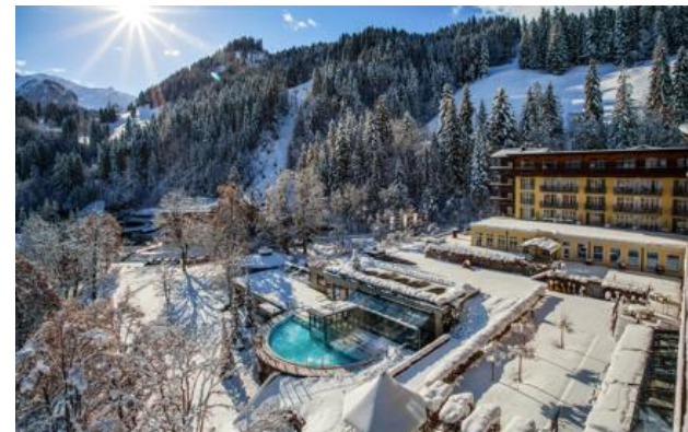
Miembro de Relais & Châteaux desde 2013 Badstrasse 20 CH-3775, Lenk im Simmental (Kanton Bern)

Hotel y restaurante en la montaña. A finales del siglo XVII, un primer hotel termal, llamado Bad Lenk, se construyó como aval del más rico manantial sulfuroso alpino, Balmen. Hoy, este manantial forma parte de la arquitectura del Lenkerhof gourmet spa resort convertido en un hotel soberbio con una gama de tratamientos de bienestar notable. Bautizado con el nombre del nacimiento del río Simme, e inspirado por la vitalidad del agua que allí brota, el "7 sources beauty & spa" ofrece una auténtica cura de rejuvenecimiento en un decorado de madera natural y piedra. Rodeado de paisajes grandiosos, el lugar es también una invitación a disfrutar de los placeres de la montaña en cualquier estación.