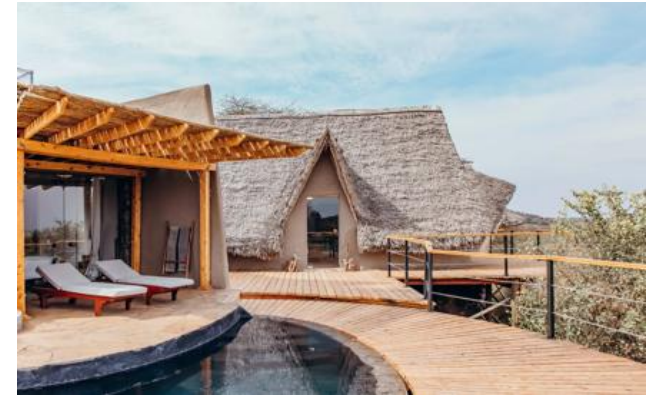
Miembro de Relais & Châteaux desde 2013 Mbirikani Group Ranch Chyulu Hills - Amboseli

Lodge y restaurante en una reserva de animales. Despertar al pie de las cumbres nevadas del Kilimanjaro y, a lo lejos, el rugido de un león. ol Donyo Lodge es uno de los pioneros de los safari-lodges, precursor del turismo ético y responsable. La colaboración con la población masai permite protegerlos y garantizar su subsistencia. Este magnífico lodge, en la ladera de las Chyulu Hills, conjuga tradición y diseño contemporáneo. Una estancia aquí es una oportunidad para explorar África de modo poco común: a pie, a caballo, en 4x4, o desde un escondite a veinte pasos de los elefantes más grandes del mundo. La situación de ol Donyo Lodge es perfecta: la sabana a sus pies hasta donde alcanza la vista. África tal como la imagina.