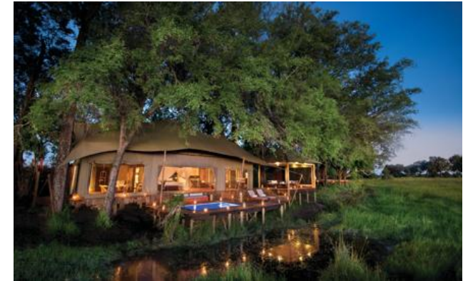
Relais & Châteaux Mitglied seit 2017 Duba Plains Private Reserve Okavango Delta

Lodge und Restaurant in einem Tierreservat. Eingebettet in eine weitläufige private Konzession im nördlichen Botswana, ist die Duba Plains Suite der Duba Concession ein wahr gewordener Traum für Liebhaber Afrikas und seiner faszinierenden Landschaften. Erleben Sie ein unvergessliches Safari-Abenteuer aus dem Komfort einer der fünf geräumigen, im Stil der 1920er Jahre gestalteten Zelt-Suiten, jede mit eigenem Swimmingpool und atemberaubendem Blick über die grünen Ebenen des Okavango-Deltas. Genießen Sie eine exklusive Land- und Wassersafari, meisterhaft geleitet von einem renommierten Naturexperten. Tauchen Sie ein in die atemberaubende Vogelwelt und bestaunen Sie Hunderte prächtiger Tiere, einschließlich seltener Kalahari-Arten, in einer spektakulären und unberührten Landschaft. Erwecken Sie täglich Ihre Lebensfreude neu in diesem wilden Paradies, welches Teil eines exklusiven Naturschutzprogramms ist, das die lokale Gemeinschaft aktiv einbindet. Die Mitbegründer des Hotels – Filmemacher und Entdecker von National Geographic – sagen, sie könnten sich nirgendwo sonst in Afrika ein umfassenderes Safari-Erlebnis vorstellen. Gehen Sie auf Entdeckungsreise und überzeugen Sie sich selbst!