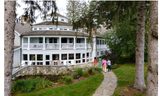
Relais & Châteaux Mitglied seit 2008 155 Alain White Road 06763, Connecticut, Morris

Hotel und Restaurant auf dem Land. Im Herzen der grünen Täler und unberührten Seen der idyllischen Litchfield Hills ist das Winvian ein Hotel-Ensemble, das sich auf 45 Hektar in einem Park mit Ahornen erstreckt. 15 verschiedene Architekten haben die 18 individuellen Chalets gestaltet. Sie können sich für das zweistöckige Treehouse in den Bäumen, zehn Meter über dem Boden, einen Leuchtturm in einem Wald oder ein Haus, das um eine alte hundertjährige Eiche herum gebaut wurde, entscheiden. Entspannen Sie im Spa. Heißluftballonfahrten, Reiten, Fliegenfischen, Automobilrennen und sonstige unvergessliche Erlebnisse stehen nur zwei Stunden von New York und Boston entfernt zur Verfügung.