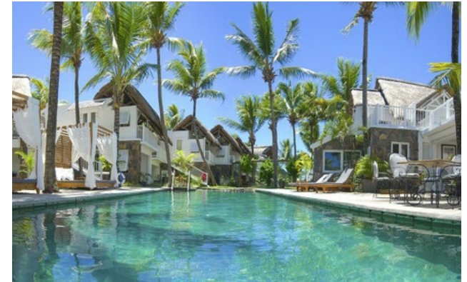
Relais & Châteaux Mitglied seit 2013 Coastal Road, Pointe Malartic Grand-Baie Pointe aux Canoniers

Hotel und Restaurant am Meer. In einem Kokospalmenhain, in der Nähe des Wassers, beherbergt ein Kolonialhaus ein von Charme geprägtes Hotel, das mit viel Eleganz eingerichtet ist. In den Zimmern stehen weiche Töne der Flamant Home Interiors-Einrichtung in einem Kontrast zum Blau des Meeres und dem Grün der Kokospalmen. Das Restaurant bietet eine kreolische und internationale Küche. Aber das 20° Sud verfügt noch über weitere Schätze: Die MS Lady Lisbeth, die einige Gäste zu einem Dîner unter Sternen in den Gewässern der Bucht fährt.