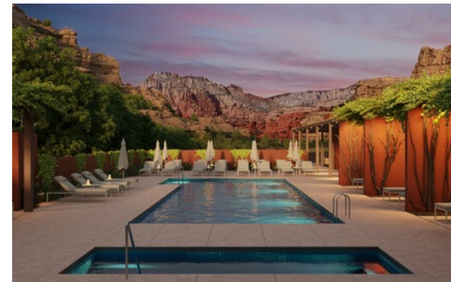
Relais & Châteaux Mitglied seit 2023 525 Boynton Canyon Road 86336, Sedona

Hotel und Restaurant in den Bergen. Mii amo ist ein renommiertes Spa- und Wellness-Resort unweit des Grand Canyon. Dieses Refugium befindet sich in den atemberaubenden roten Felsen des Boynton Canyon, einem der mächtigsten Energiezentren von Sedona, Arizona. Verbinden Sie sich wieder mit der Natur und mit sich selbst in einer bezaubernden Umgebung, in der die Hotelanlage so gestaltet ist, dass sich die Gäste innerhalb des Canyons noch wohler fühlen. Die Zimmer sind mit Naturteppichen, Holz und handgefertigten Decken ausgestattet und bieten einen Blick auf die Weite der mit Kaktusfeigen und Pinyon-Kiefern übersäten Landschaft. Alle haben einen offenen Kamin und eine eigene Terrasse. Das Mii amo, das für seinen einzigartigen ganzheitlichen Ansatz bekannt ist, bietet all-inclusive- und individuelle spirituelle Reisen an, einschließlich maßgeschneiderter Behandlungen und geführter Meditationen, die von intuitiven und erfahrenen Fachkräften durchgeführt werden. Auf diese Weise sind Körper und Geist miteinander verbunden und genießen die Gaumenfreuden, die der Küchenchef vom Hummingbird sich ausgedacht hat. Er bevorzugt eine Küche mit Produkten aus der Region.