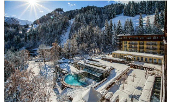
Relais & Châteaux Mitglied seit 2013 Badstrasse 20 CH-3775, Lenk im Simmental (Kanton Bern)

Hotel und Restaurant in den Bergen. Ende des 17. Jahrhunderts wurde ein erstes Kurhotel, das Bad Lenk, etwas abwärts von der reichsten alpinen Schwefelquelle nördlich der Alpen, des Balmes gebaut. Bis um die Jahrtausendwende wurde Schwefel als Heilmittel verwendet, trinken kann man es noch heute. Historische Schriften und eine Mischung von nostalgischen Kurhauselemente und moderner Architektur prägen das Lenkerhof Gourmet Spa Resort, ein erstklassiges Hotels mit einem breiten Angebot wunderbarer Wohlfühl-Behandlungen. Das „7 Sources Beauty & Spa“ ist nach dem Ort «Siebenbrunnen» benannt, an dem die Simme entspringt und wird von der Energie und Vitalität der Quelle inspiriert. In der Umgebung aus Naturholz und Naturstein genießen Sie eine echte Verjüngungskur. Die prachtvolle Landschaft der Umgebung lädt zu jeder Jahreszeit ein, die besonderen Freuden der Berge zu genießen.