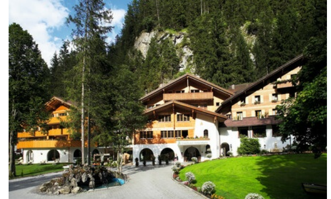
Relais & Châteaux Mitglied seit 2016 Doldenhornstrasse 26 3718, Kandersteg

Hotel und Restaurant in den Bergen. In dem kleinen Skiort Kandersteg gelegen, bietet dieses familiäre Hotel mit seinen großen, von immergrünen Bäumen umstandenen Chalets und seinem Blick auf die Berge eine postkartenwürdige Ansicht. Im Sommer wie im Winter genießen Sie hier die Vergnügen, die die umliegende, direkt vom Hotel aus zugängliche Natur zu bieten hat, oder Sie profitieren von den zahlreichen Wellness-Einrichtungen - Pool, Sauna, Bäder, Entspannungsbereich -, die im Einklang mit der Umwelt errichtet wurden. Die geschmackvoll ausgestatteten Zimmer bieten Panoramablicke auf den Wald oder die Berge. Der persönliche Service, die herzliche Atmosphäre und die wunderbare Küche tragen dazu bei, Körper und Geist neu zu stärken. Auf der anderen Straßenseite bietet das Restaurant Ruedihus, ein geschichtsträchtiger Ort, typische schweizerische Gerichte.