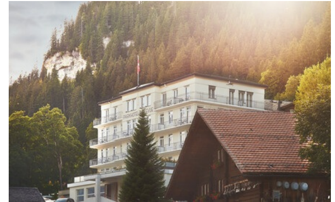
Relais & Châteaux Mitglied seit 2022 Bellevuestrasse 15 3715, Adelboden (Bern)

Hotel und Restaurant in den Bergen. Das Bellevue Parkhotel & Spa erhebt sich stolz inmitten eines Tales, umgeben von einer der schönsten Alpenlandschaften der Schweiz und überblickt den traumhaften Wintersportort Adelboden. Hier, südlich von Bern, fügt sich das Boutique-Hotel mit seiner eleganten Silhouette und dem charmanten Midcentury-Design harmonisch in die Umgebung ein. Die Zimmer sind großzügig geschnitten und lichtdurchflutet durch große Fenster. Die Natur scheint in den Raum hineinzuwachsen. Der schöne Garten mit seinen knorrigen Ahornbäumen ist der ideale Ausgangspunkt für zahlreiche Aktivitäten im Sommer wie im Winter. Ob zu zweit oder mit der ganzen Familie: Genießen Sie die 210 Pistenkilometer des Skigebietes, wandern Sie durch die herrliche Natur oder entdecken Sie den Dorfkern von Adelboden mit seinen charmanten Chalets. Im Spa des Bellevue Parkhotel & Spa kommen die Vorzüge des bekannten Kurortes voll zur Geltung: Es beeindruckt mit Hallenbad und Außensolebad, Dampfbädern, Saunen und modernsten Fitnessgeräten. Lassen Sie sich mit Treatments verwöhnen und bewundern Sie die atemberaubende Aussicht im Außenbereich. Ein elegantes Dinner erwartet Sie im renommierten Gourmetrestaurant Belle Vue, wo Sie die kreative Schweizer Küche von Küchenchef Jürgen Willing genießen können.