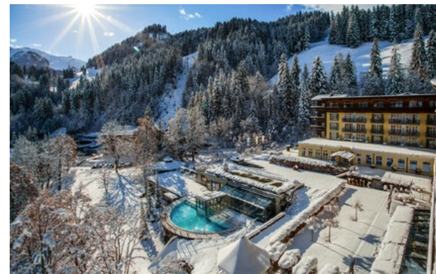
Relais & Châteaux Mitglied seit 2013 Badstrasse 20 CH-3775, Lenk im Simmental (Kanton Bern)

Hotel und Restaurant in den Bergen. Ende des 17. Jahrhunderts wurde ein erstes Kurhotel, das Bad Lenk, etwas abwärts von der reichsten alpinen Schwefelquelle nördlich der Alpen, des Balmen gebaut. Bis um die Jahrtausendwende wurde Schwefel als Heilmittel verwendet, trinken kann man es noch heute. Historische Schriften und eine Mischung von nostalgischen Kurhauselemente und moderner Architektur prägen das Lenkerhof Gourmet Spa Resort, ein erstklassiges Hotels mit einem breiten Angebot wunderbarer Wohlfühl-Behandlungen. Das „7 Sources Beauty & Spa“ ist nach dem Ort «Siebenbrunnen» benannt, an dem die Simme entspringt und wird von der Energie und Vitalität der Quelle inspiriert. In der Umgebung aus Naturholz und Naturstein genießen Sie eine echte Verjüngungskur. Die prachtvolle Landschaft der Umgebung lädt zu jeder Jahreszeit ein, die besonderen Freuden der Berge zu genießen.